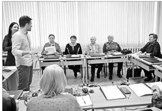
AIZKRAUKLES SENIORU BIEDRĪBAS “ASKRĀDE” dalībnieku datorapmācības nodarbību noslēgums.

Ar laikraksta starpniecību Madara informē, ka šobrīd tiek komplektēta grupa datorprasmiņu apguvei un apmācība notiks jūnijā. Pieteikties var pa tālruni 27898033. Tā tiešām būs laba iespēja apgūt elementāras zināšanas klātienē, kur līdzās būs pedagogs. Viņš gan mācīs rīkoties ar datoru, gan arī atbildēs uz