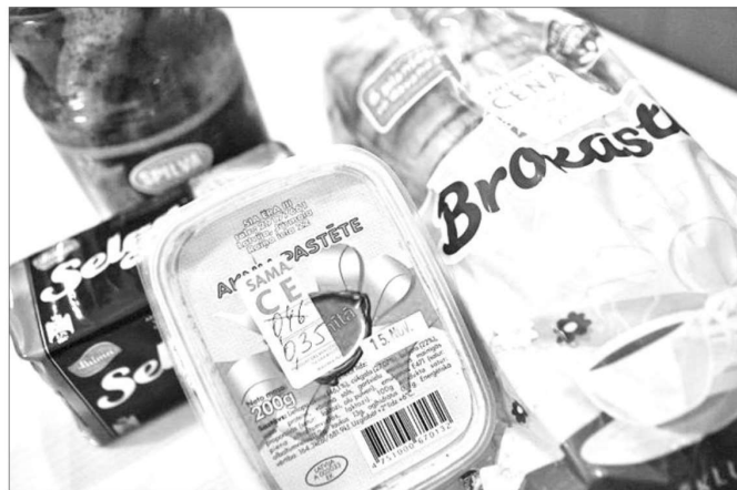
LABI PRODUKTI PAR IZDEVĪGU CENU. Pārtikas preces ar mazu vai tās dienas ieteicamo derīguma termiņu pareizas glabāšanas gadījumā var lietot uzturā arī pēc ražotāja norādītā datuma.

Projektu finansē Mediju atbalsta fonds no Latvijas valsts budžeta līdzekļiem. Par materiāla saturu atbild laikraksts "Staburags".