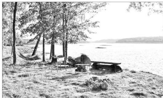
ATPŪTA uz saliņas.

Atpūtas komplekss "Daugavas Avoti" Klintaines pagastā ir viesu māja, kur netraucētu atpūtu un Daugavas tuvumu var baudīt vien pāris desmitus metru no Rīgas—Daugavpils šosejas. Koku ieskaudā vieta ir kā sava oāze gan tās saimniekiem, gan atpūtniekiem.