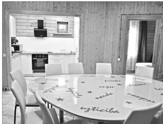
MĀJINĀS labiekārtotas viesu ērtībām.