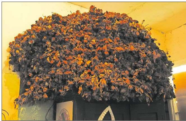
KONCERTOS DĀVINĀTĀS rozes.

arī dziesmas rindas, kuras komponists ietērpa mūzikā.