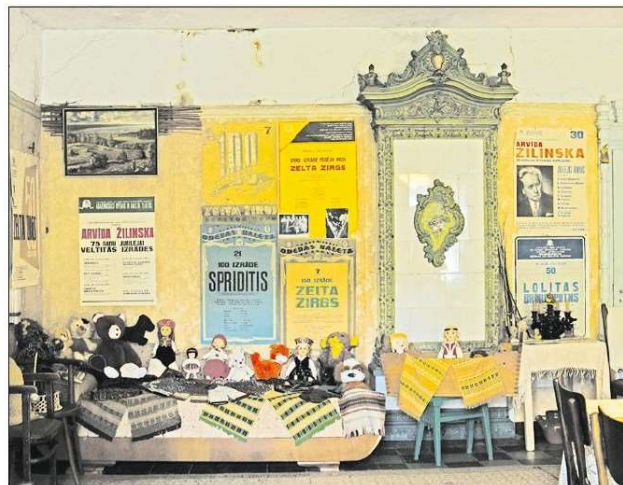
DAŽĀDAS PIEMIŅAS LIETAS.