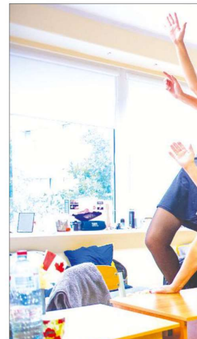
VISI "SĒĻI" VIENUVIET. Maza atelpa pirms