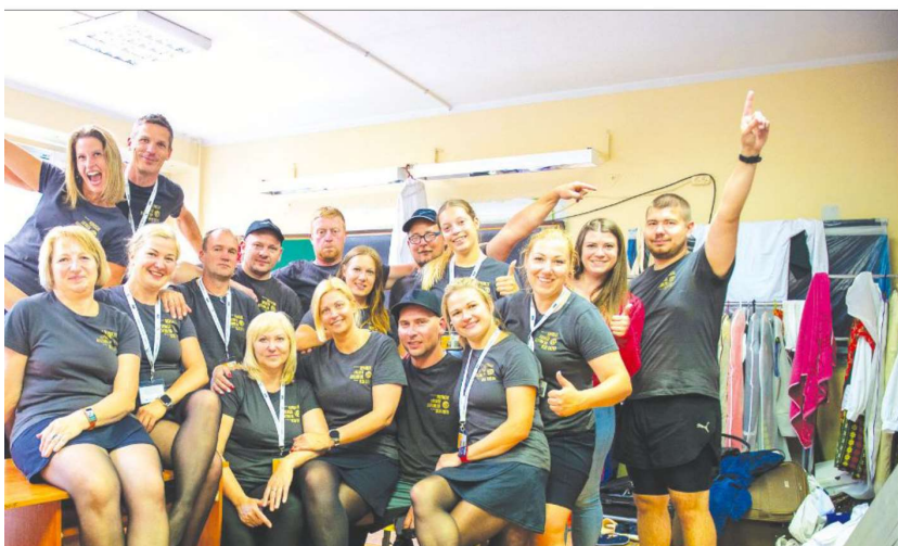
ms vakara mēģinājuma.