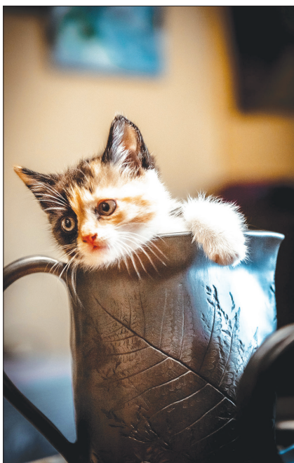
MAZAIS PALĪGS. Kaķēna saimnieki teic, ka viņš labprāt iekārtojās uz guļu kādā māla traukā.