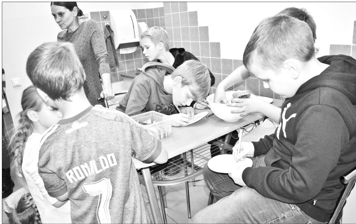
ĒD LOKĀLI — DOMĀ GLOBĀLI. Pļaviņu vidusskolas Ekopadome viesojās centrā "Pepija".