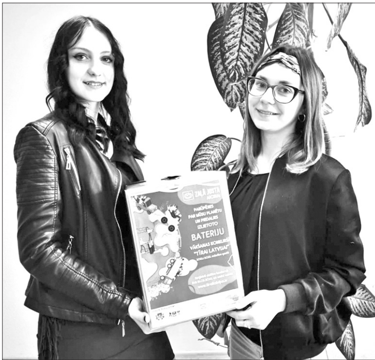
KOPĀ. Jaunieši Aizkraukles Profesionālajā vidusskolā darbojas aktīvi.